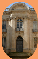
HÔTEL DE SENECÉ