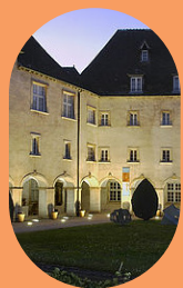
COUR DU CLOÎTRE DU MUSÉE DES URSULINES